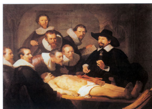
Rembrandt, La leçon d'anatomie du Dr Tulp